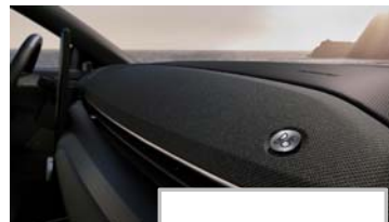
B&O zvočni sistem