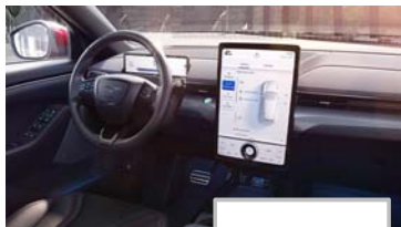
Ford SYNC 4A