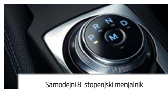
Samodejni 8-stopenjski menjalnik