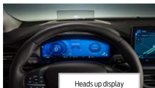
Heads up display