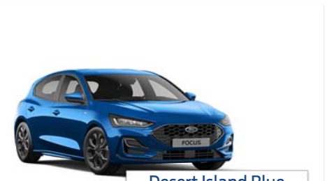
Desert Island Blue